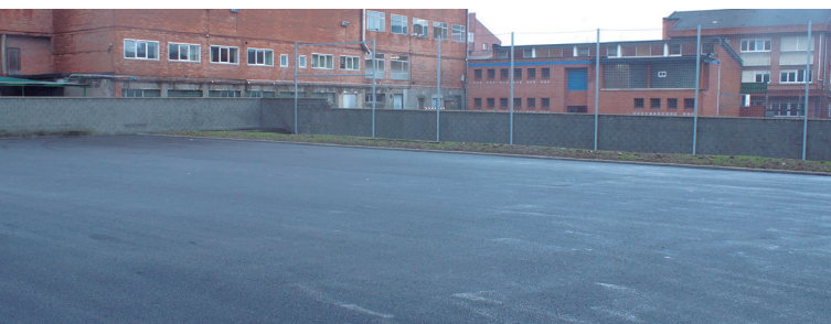
PATIOA / PATIO